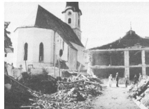
Aufkirchen nach dem Bombeneinschlag am 20.09.1942. Die Kirche und das Mesnerhaus