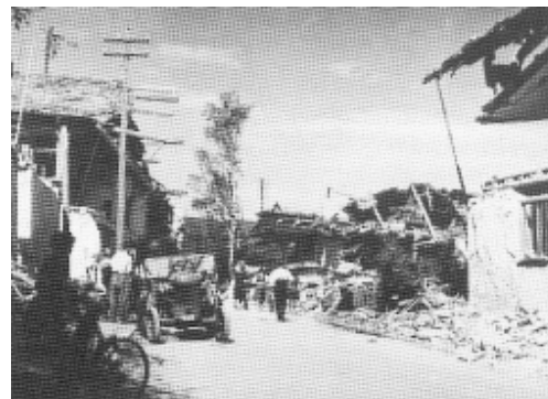
Die Ortsdurchfahrt von Aufkirchen nach dem Bombeneinschlag am 20.09.1942 v.l.n.r.: Friedhofsmauer-Mesnerhaus-Pfarrhaus- Dieslanwesen und Gendarmerie-Gebäude

Im Dezember 1943 stellte man für Notfälle eine Frauengruppe aus 11 Feuerwehrmädchen zusammen. Der Krieg schlug tiefe Wunden, die Heimat war ausgeblutet. Auch unsere Wehr lag darnieder.