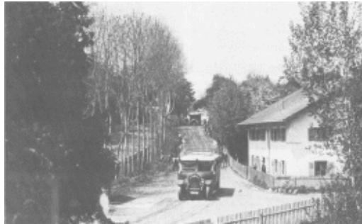
v.l.n.r. Schatzl-(Huber)Garten, heutige Grafstraße, Schranner-Anwesen, Perchastraße. Der Bus fährt in die Aufkirchener Straße ein.

Omnibus-Verkehr Eröffnung München-Ambach um 1926: