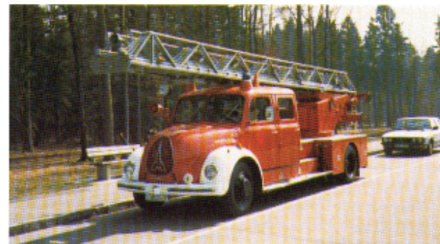
DL am Rastplatz 1981

Beschluß zum Erwerb einer gebrauchten DL 30 h von der BF München, nach eingehenden Beratungen mit der gesamten Wehr. Verkauf der bisherigen DL 18 h, nach Indienststellung der neuen Leiter. Abwicklung des Fahrzeugwechsels ausschließlich aus angesammelten Eigenmitteln ohne Belastung des gemeindlichen Haushaltes. Verlängerung des DL-Standplatzes im Gerätehaus (nach hinten), durch Ludwig Haberle als Spender